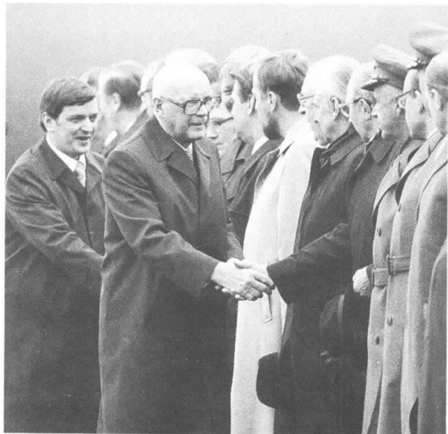
Presidentti Kekkonen palaamassa onnistuneelta valtiovierailultaan Saksan liittotasavallasta.