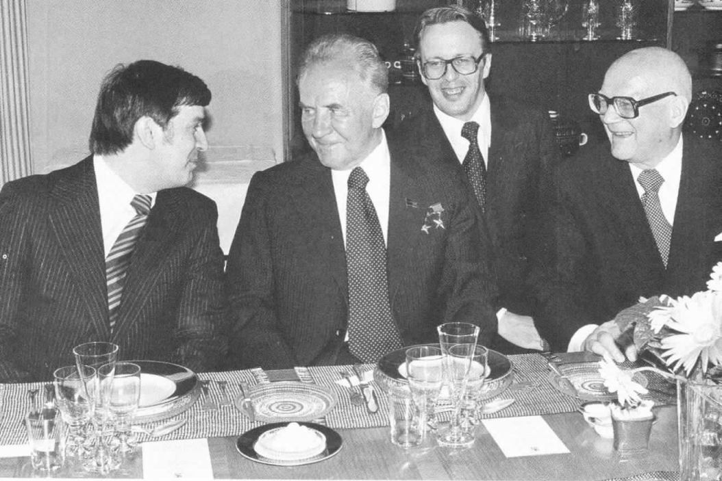
Valtiovierailun yhteydessä järjestettiin virallinen lounas Suomen Moskovan-suurlähetystössä. Urho Kekkonen esitteli leikkisään sävyyn Paavo Väyrysen Aleksei Kosyginille.