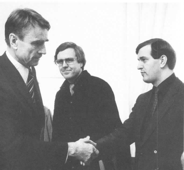
Vt. presidentti Mauno Koivisto on saapunut presidentin esittelyyn 23. 10. 1981. Mauno Koiviston tukija Kalevi Kivistö seuraa taustalla, kun tuleva presidentti käättelee ulkoministeriä, joka joutuu väistymään presidentinvaalien jälkeen.