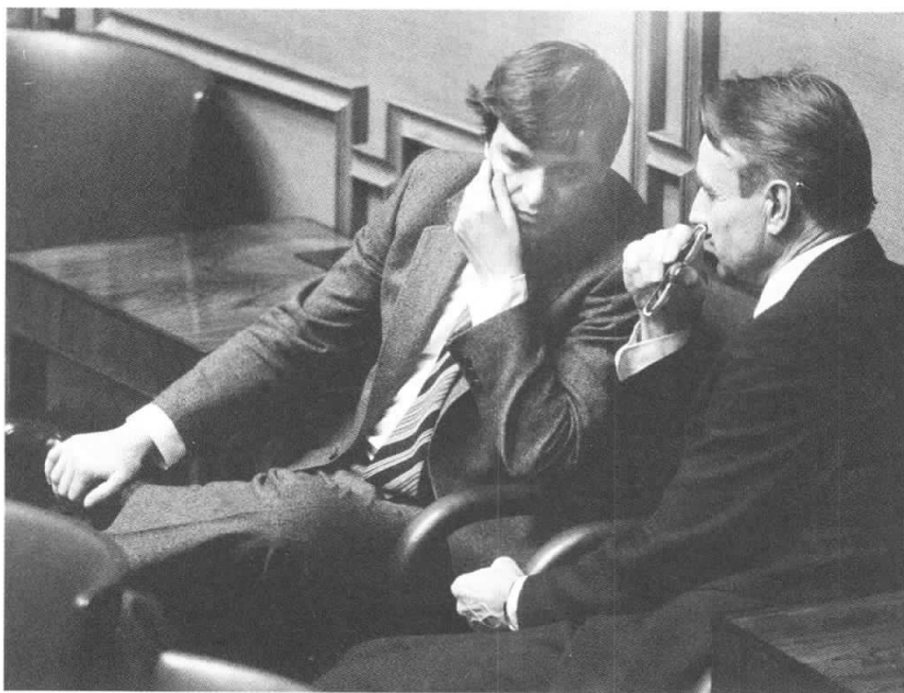
Koiviston hallituksen keskeiset hahmot: pääministeri Mauno Koivisto keskustelee ulkoministeri Paavo Väyrysen kanssa eduskunnan ministeriaitiossa marraskuussa 1980.