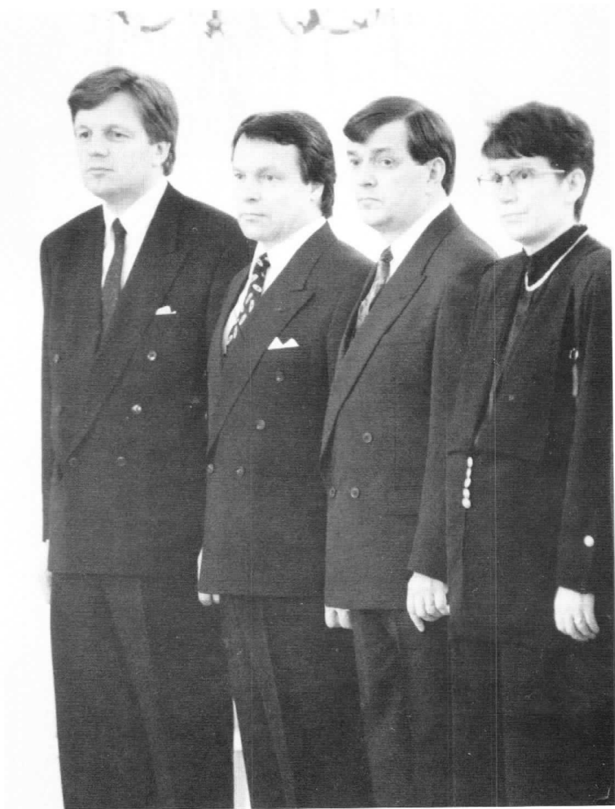
Pääministeri Esko Ahon johtama hallitus nimitettiin 30.4.1991. Sen ulkoasiainministeriksi nimitettiin valtiotieteen tohtori Paavo Väyrynen, jolla oli tuntuvasti pitkäaikaisempi hallituskokemus kuin yhdelläkään muulla ministerillä. Virkaiältään toiseksi vanhin oli sosiaali- ja terveysministeri Eeva Kuuskoski. Pääministerin sijaiseksi nimitettiin aluksi työministeri Ilkka Kanerva.